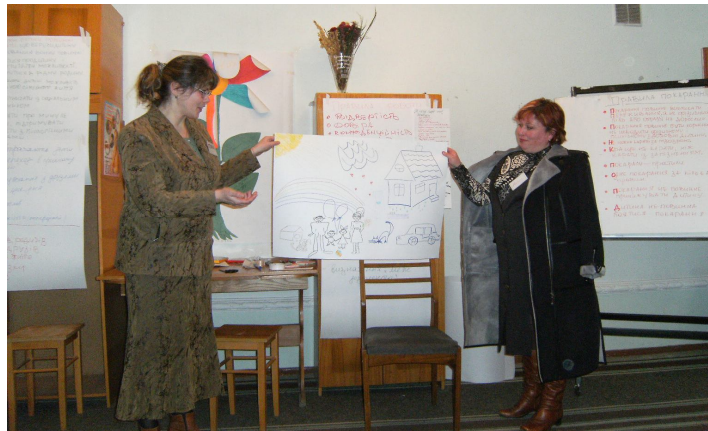
Тренінги для прийомних батьків та потенційних претендентів в прийомні батьки, м. Тернопіль