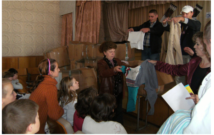
Роздача гуманітарної допомоги вихованцям інтернату с.Нове-Село