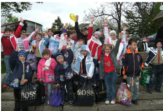
Акція «Подаруй радість на Великдень у родині» с.Коропець