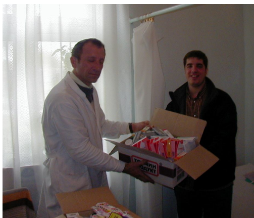
Медикаменти для дітей-сиріт Коропця