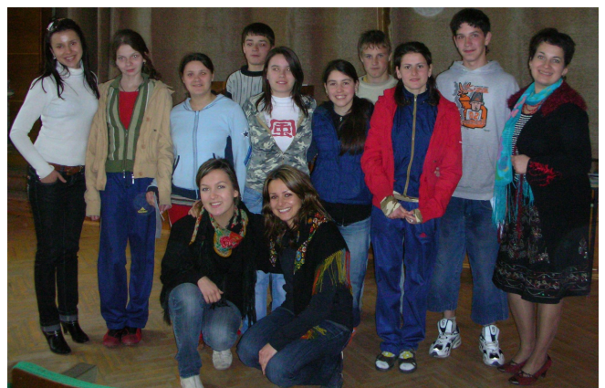
Тренінг «Формування свідомості до проблем торгівлі людьми», випускники с.Коропець