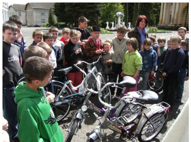
Велосипеди на Великодні свята для дітей-сиріт