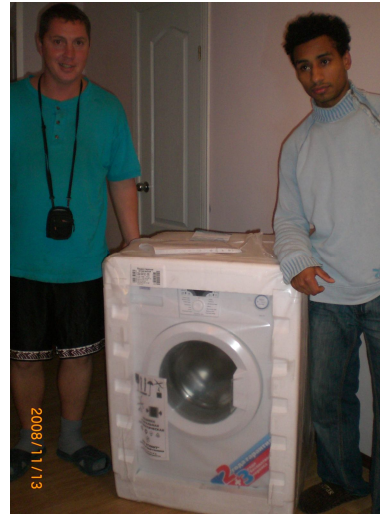
Підтримка випускників в міському соц. гуртожитку