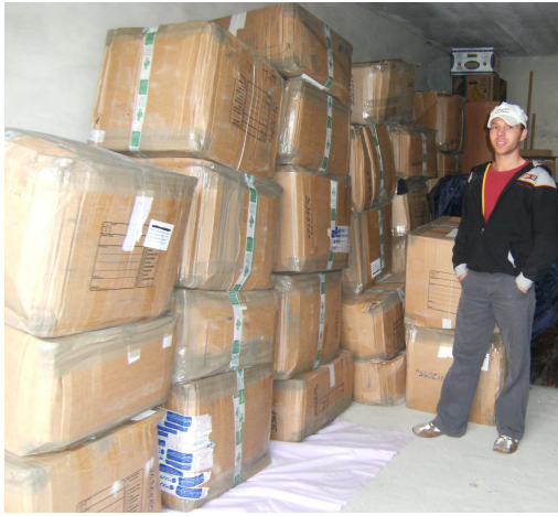
Гуманітарна допомога для дітей-сиріт