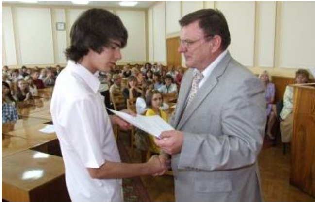
Вручення направлень випускникам з числа сиріт в ТОДА