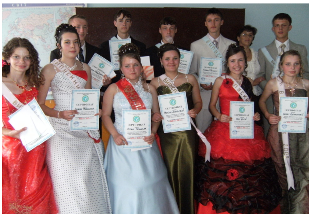
Акція «Випускник 2008», с. Коропець

- оплачено навчання студента –сироти 1 курсу в Академії ім. Героїв Чорнобиля МНС України.